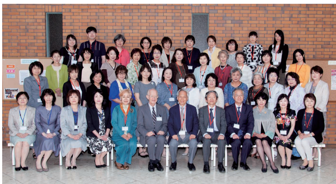
第43回同窓会定期総会にて

多くは事務局の方が準備をして下さいます。私たちの仕事は、懇親会のビンゴゲームの賞品選び、前もって行われる会場の設営、当日の受付、懇親会の進行をすることでした。懇親会の内容も自由に企画できるのですが、本年度は参加者同士がゆっくり会話を楽しめるようにとあえて特別なことはしませんでした。 私は、この当番学年を経験することで、久しぶりに会った仲間と貴重な時間を過ごすことができました。 これから先も同窓会総会は開催されていくわけですが、多くの卒業生の方が参加され、ますます盛会となることを期待します。